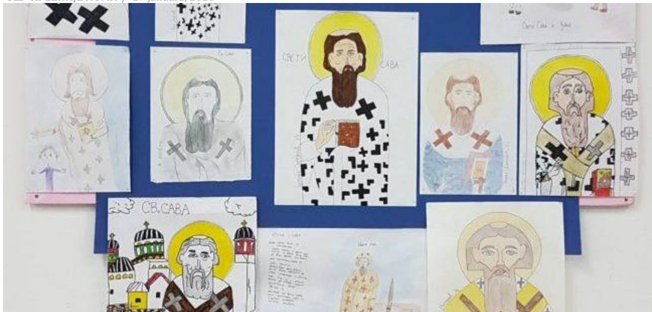
У сусрет Савиндану

Ближи се празник посвећен првом српском просветитељу и заштитнику школства, Светом Сави. Њему у част у нашој школи, у Угриновцима, сликало се, илустровало и цртало у духу светосавља. Вредни ученици инспирисани животом и делом Светог Саве кроз прочитане и научене приче и песме своје утиске су вешто пренели на час ликовне културе. Радови су се низали док су покрети четкица градили јединствене и различите погледе на исти лик. Са великим поносом посматрали су своја дела где су доказали да Савиндан није само школска слава већ празник целе наше културе, када славимо знање, човекољубље, слогу и мир.