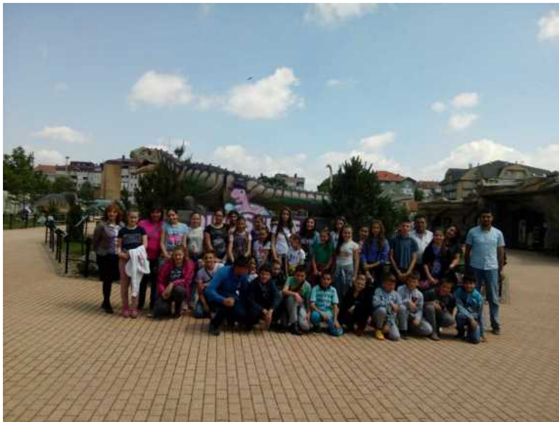
Ученици V и VI разреда на екскурзији СВИЛАЈНАЦ (Природњачки парк)- МАНАСИЈА – РЕСАВСКА ПЕЋИНА – ЈАГОДИНА (Зоолошки врт, Музеј воштаних фигура)