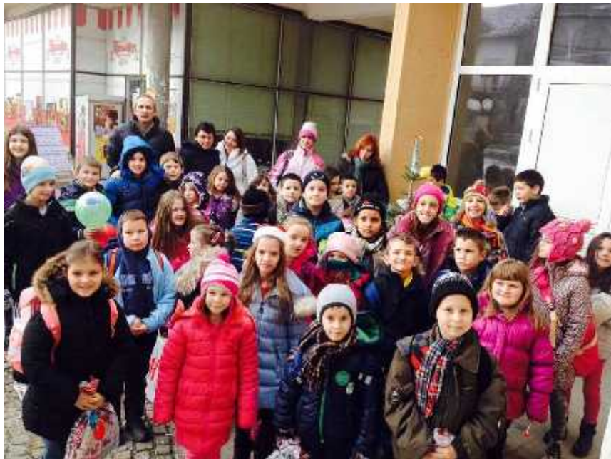
Најмлађи школарци окитили јелку испред Дома културе