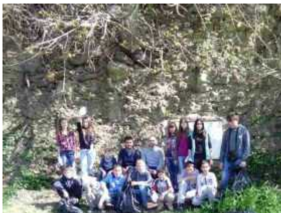
Акција чишћења у ИО Угриновци