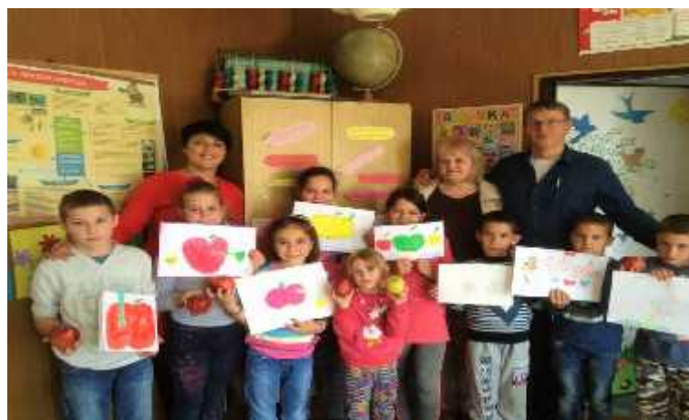
Педагог школе и учитељи ИО Трудељ и ИО Драгољ са својим ученицима