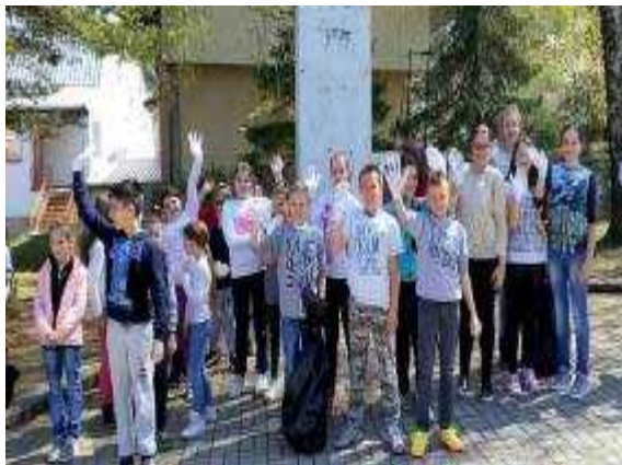
Акција чишћења у матичној школи

Традиционална пролећна акција чишћења „Очистимо наш град и општину“ спроведена је и у рудничкој школи, 10. априла 2017. године. У акцији су учествовали ученици рудничке и угриновачке школе, са својим разредним старешинама. Сви су били јединствени у задатку да се покупе папири, пластичне флаше, кесе и друго заостало смеће. Акција је почела поделом рукавица и кеса у школском дворишту. Савезник у овој акцији, учесницима акције, било је лепо и сунчано време.