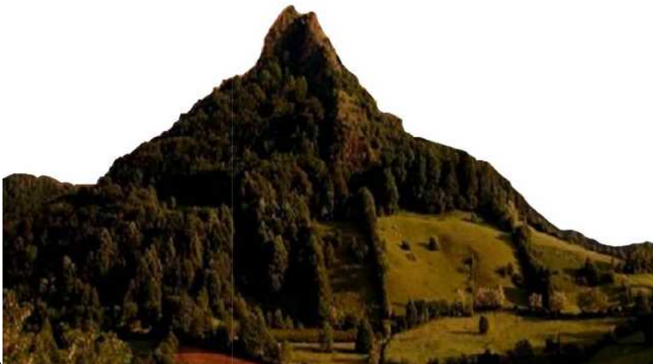
Рудник, 2016. године